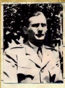
Květoslav Prokeš (1897–1949)