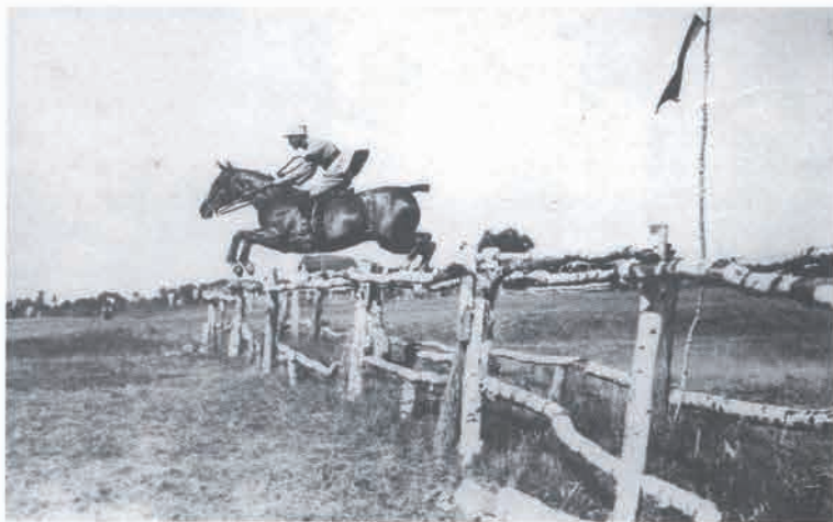
Ve vojenské jezdecké škole v Saumuru ve Francii 1924